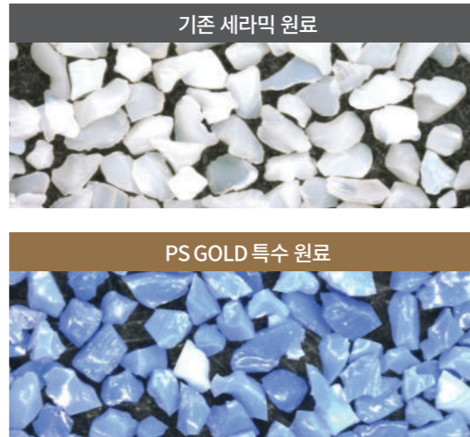
실제 원료 광학현미경 50배 촬영