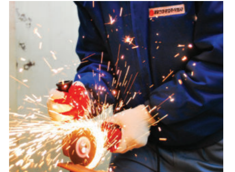
수명 및 절단 속도 자체 테스트